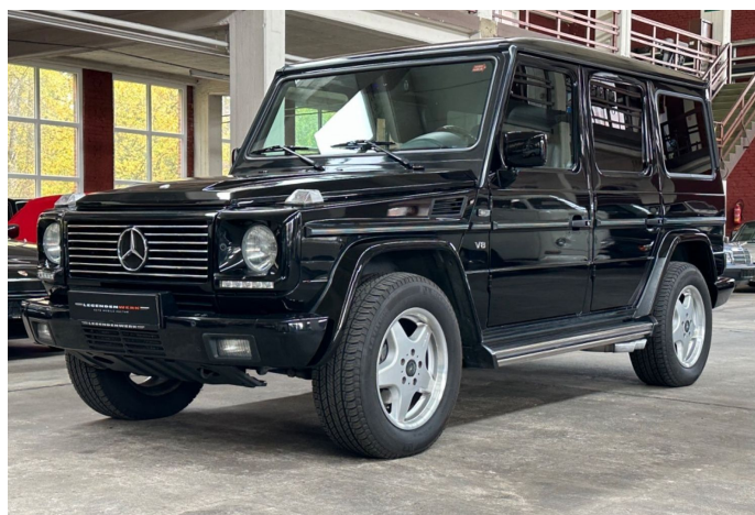
LegendenWerk auto mobile kultur