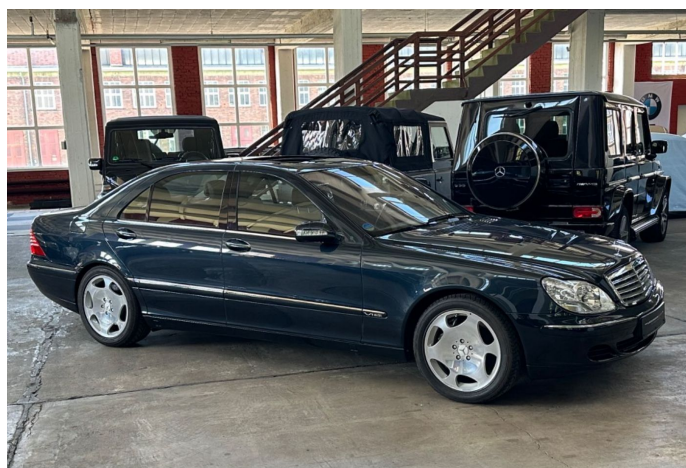
LegendenWerk auto mobile kultur