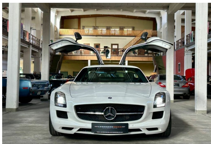
LegendenWerk auto mobile kultur