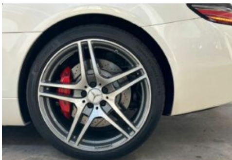
LegendenWerk auto mobile kultur