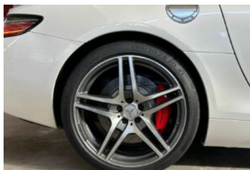
LegendenWerk auto mobile kultur