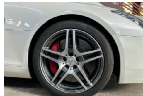
LegendenWerk auto mobile kultur