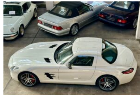
LegendenWerk auto mobile kultur