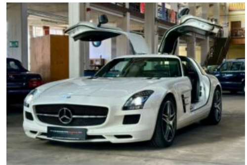
LegendenWerk auto mobile kultur