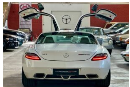
LegendenWerk auto mobile kultur