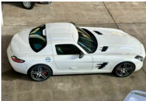
LegendenWerk auto mobile kultur