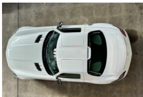
LegendenWerk auto mobile kultur