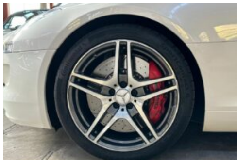
LegendenWerk auto mobile kultur