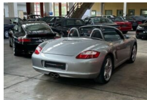
LegendenWerk auto mobile kultur