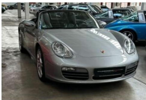
LegendenWerk auto mobile kultur