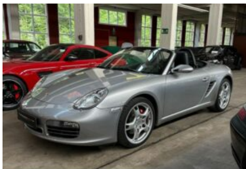
LegendenWerk auto mobile kultur