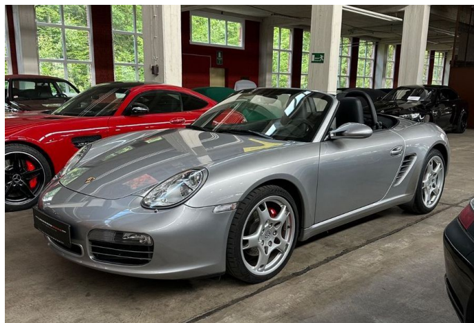
LegendenWerk auto mobile kultur