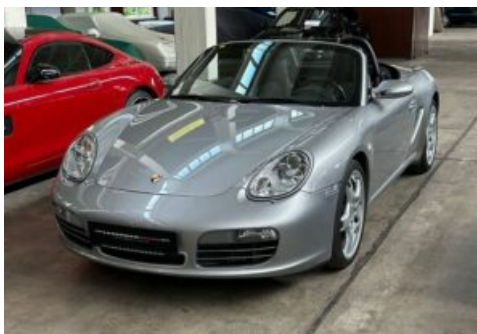
LegendenWerk auto mobile kultur