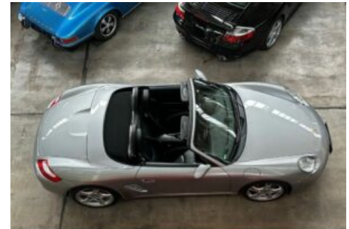
LegendenWerk auto mobile kultur