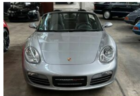
LegendenWerk auto mobile kultur