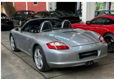
LegendenWerk auto mobile kultur